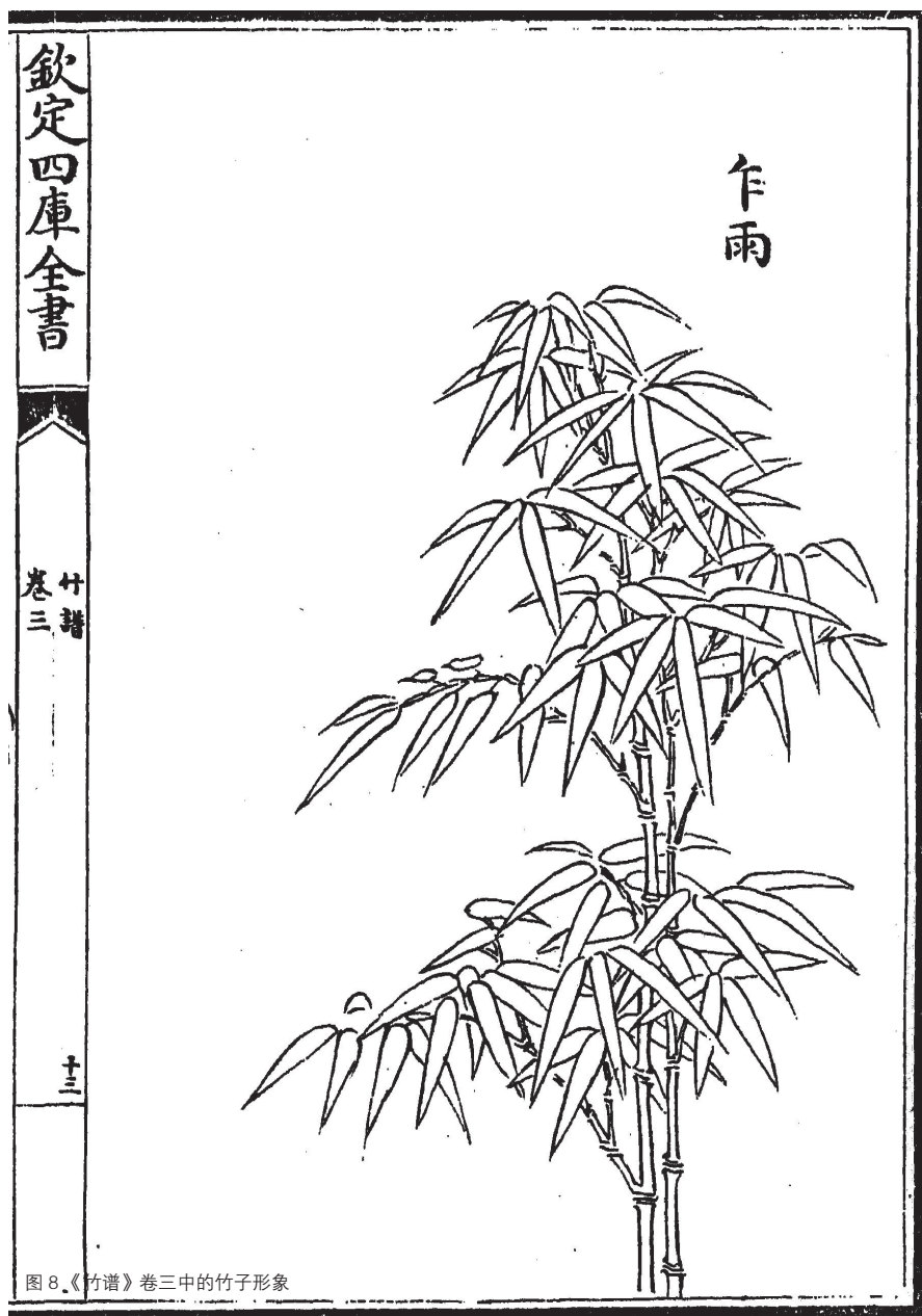
图8.《竹谱》卷三中的竹子形象