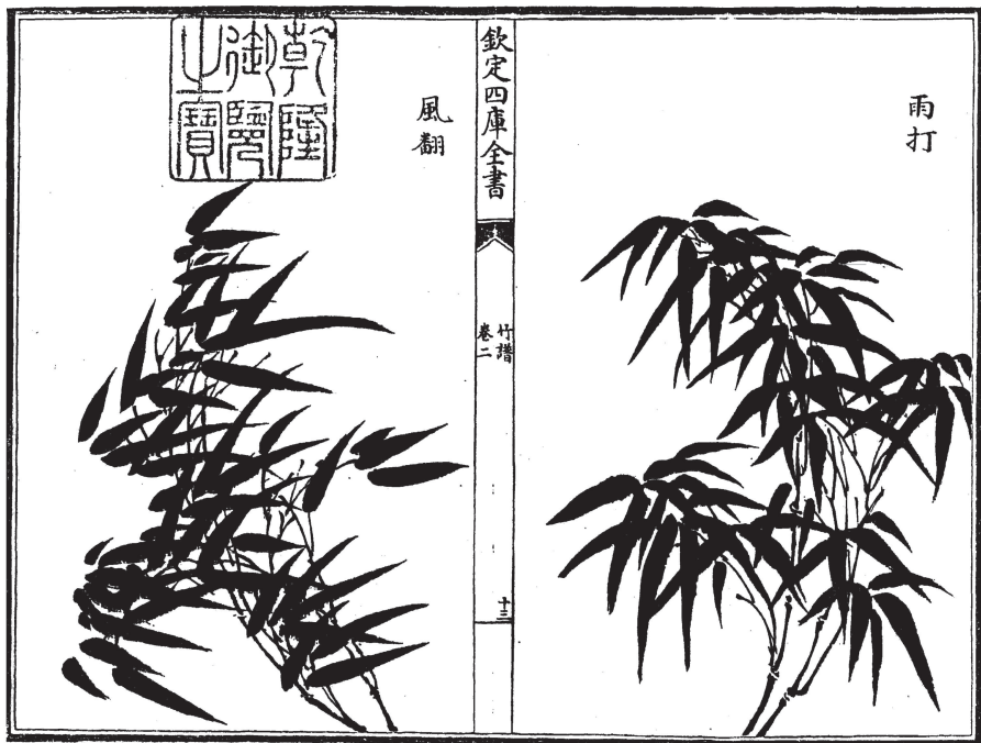
图6《竹谱》卷二中的竹子形象

较之于铭刻儒家经典，石碑最常见的用途还是统治者用于维护自己的统治。忠、孝、义等为统治者所尊崇的行为，往往是明清时