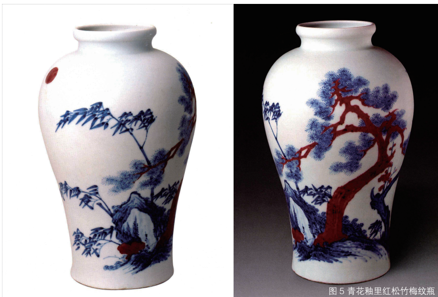
图5青花釉里红松竹梅纹瓶