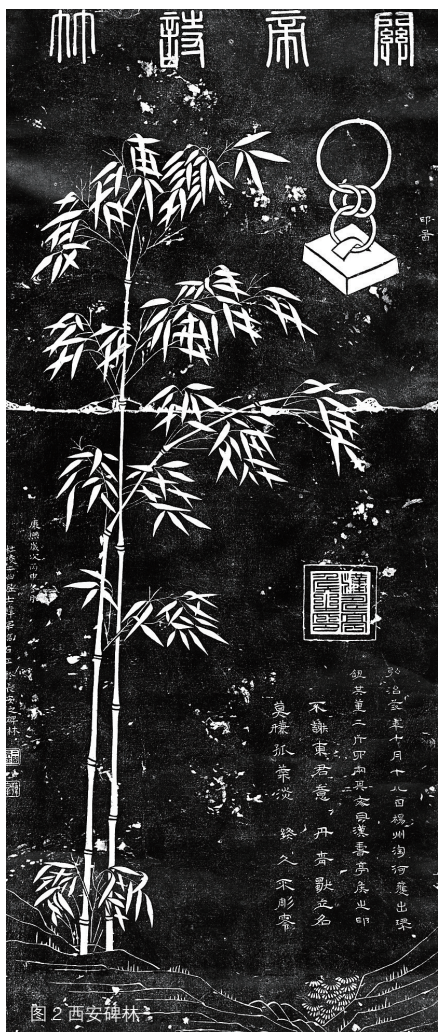
图2 西安碑林 习惯。在中国历史上，绘画的地位低于书法，画师在很长一段时间内不被上流社会所看重。这种情况直到五代皇家画院的开设，才有了改善。那么三国时代被封为汉寿亭侯的关羽，以绘画这一形式向曹操表达婉拒，显然不合乎礼节。其实，石碑这一媒材本身就不可能是三国时期的作品。在东汉末年，中央政权衰微，群雄争霸，连年的征战严重削弱了政府与地方的财力。因此，曹魏政权明令禁碑，吴、蜀虽无禁令，但财力有限，碑刻极少。现存为数不多的三国碑刻，大多是当时的统治者为维护其统治而有意为之。 [4] 那么说来，即使当时的关羽能在石头上刻下如此图像，人们想要传播这一图像，而把它翻刻到别处，也是不可能的。