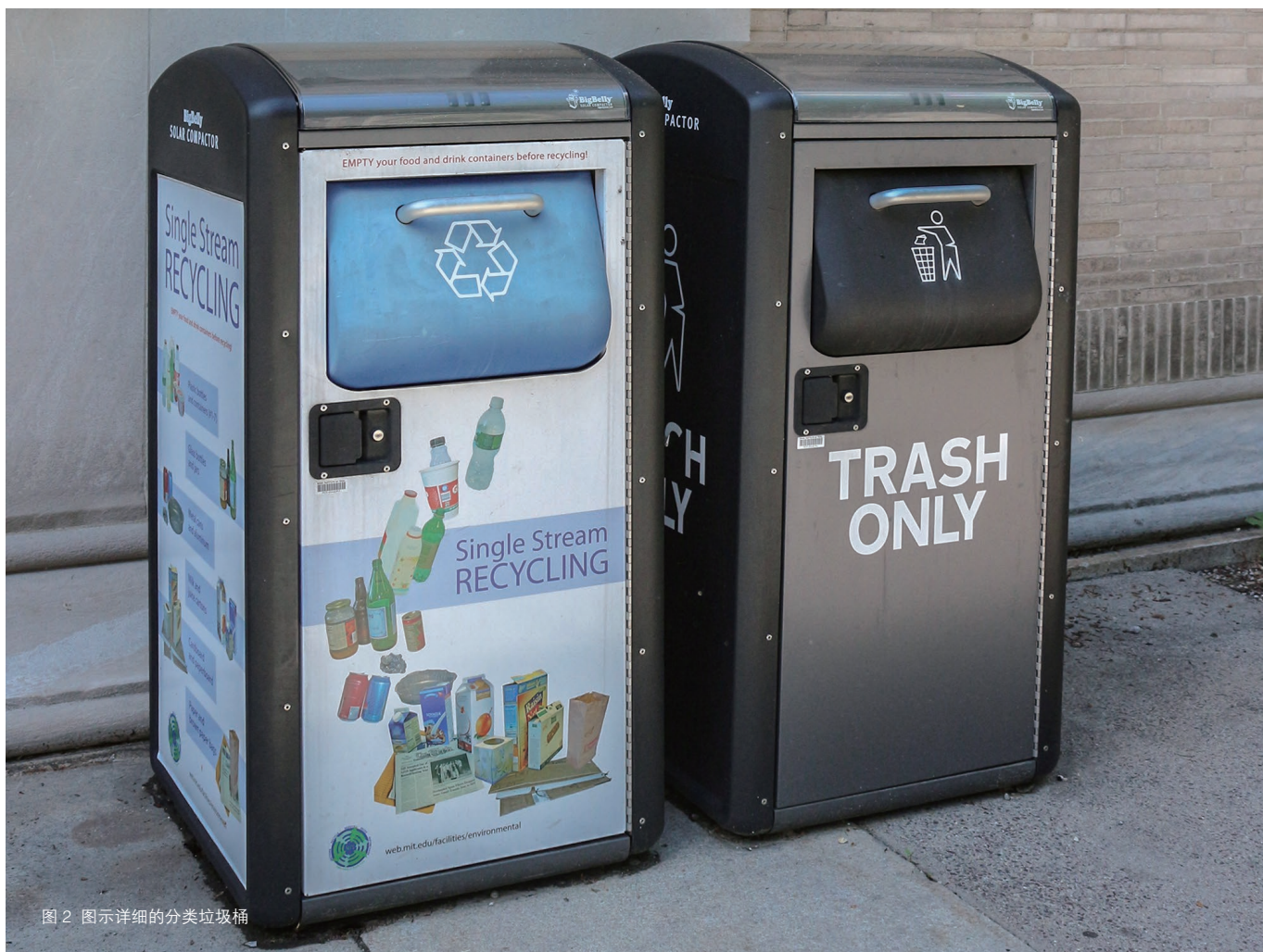
图2 图示详细的分类垃圾桶

育赛事的增多, 国内的一些大城市, 如北京、上海、广州等较早意识到通用设计的重要, 并在很多城市建设项目中实践。例如北京长城故宫电梯的加装, 国家体育馆无障碍卫生间的增设, 颐和园、天坛公园无障碍设施的完善, 五棵松篮球场饮水设施的安装等, 为人们的出行提供了便利。而在一些中小城市, 政府对通用设计认识不足, 经费投入有限, 很多公共建筑中很少考虑通用设计。此外, 同一城市内, 通用设计在建筑群中的分布也存在不平衡。除了一些规格较高的建筑、城市地标性建筑群、重要的交通枢纽外, 很多公共建筑如社区菜场、商场、餐厅、学校等, 很少考虑通用设计的建设。不仅如此, 即使在有通用设计的建筑内, 它的分布也存有局