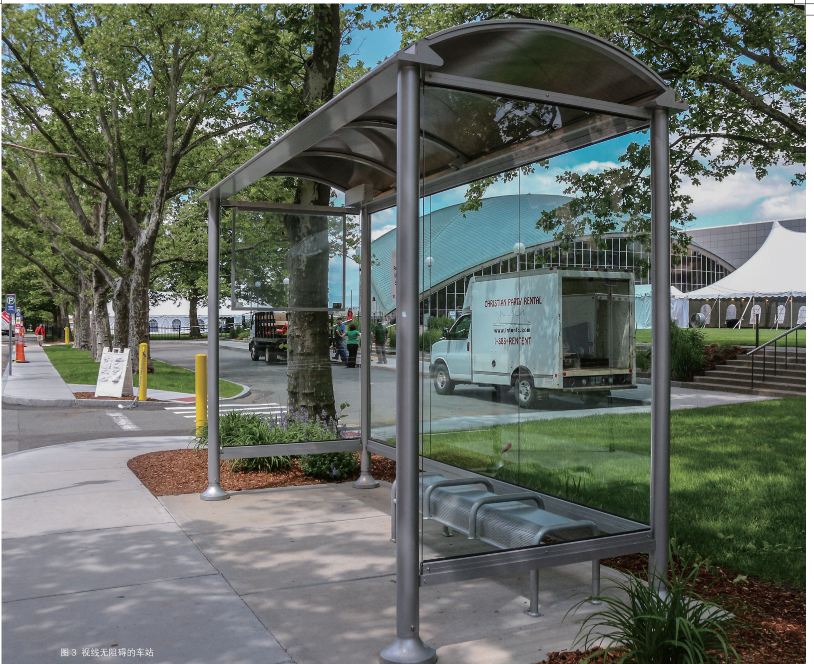
图3 视线无障碍的车站

限。有的建筑虽有入口坡道，垂直电梯，但缺少自动开门按钮或同层间的坡道设计；有的洗手间内虽有无障碍厕位，但没有婴儿护理空间或低位洗手台；有的标识设计虽然在文字和色彩上考虑到可见度和易辨性，但没有盲文辅助或声音向导等。总之，建筑内无障碍环境不完整，缺乏系统化。