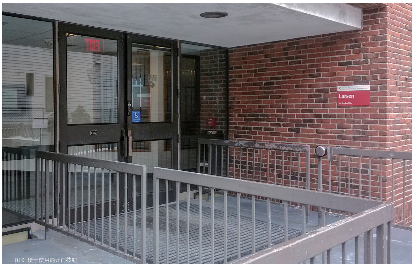
图9 便于使用的开门按钮

有四部法案对其有积极的推动作用。一是1968年的《建筑障碍法案》(ABA)，法案规定以联邦资助的方式对公共设施进行易用性设计和建设，并将其应用到建筑、修复和租用设备中。二是1973年的《修复法案》，该法案旨在排除对残障人群的歧视。它强制性要求所有的联邦代理或有联邦资助的项目在所有设计中必须考虑残障人士使用的便利。该法案为美国残障人群愿意工作和可以工作提供了可能。三是1975年发布的《关于所有残障儿童享有平等教育的法案》，它提倡残障儿童与其他儿童一样接受主流教育。该法案不仅改变了人们对障碍儿童“能力有限”的偏见，而且让这些孩子尽早接受主流教育，为他们享有平等工作机会和社会服务奠定了基础。1990年7月26日，在白宫前，由乔治·布什总统签名通过的《美