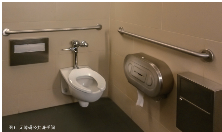
图6 无障碍公共洗手间

或取水服务，它们大多被安装在洗手间附近，饮水台面都有高低两个标准，而且取水按钮面积很大，手掌轻轻一按，水柱喷出，非常方便（图7）。与直饮水一样普及的是室外