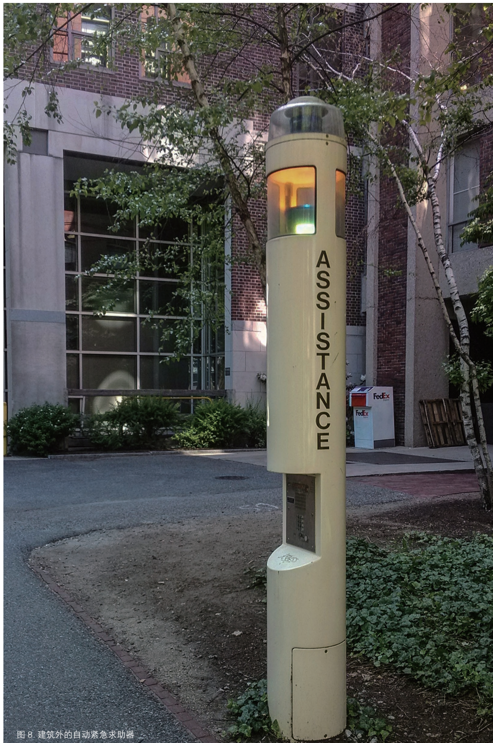
图8 建筑外的自动紧急求助器

剑桥市是美国最古老的城市之一,但其通用设计却与其他新城市一样完备,这不得不归功于美国完善的法律制度和严格的监督体制。追溯美国通用设计发展历史,其中