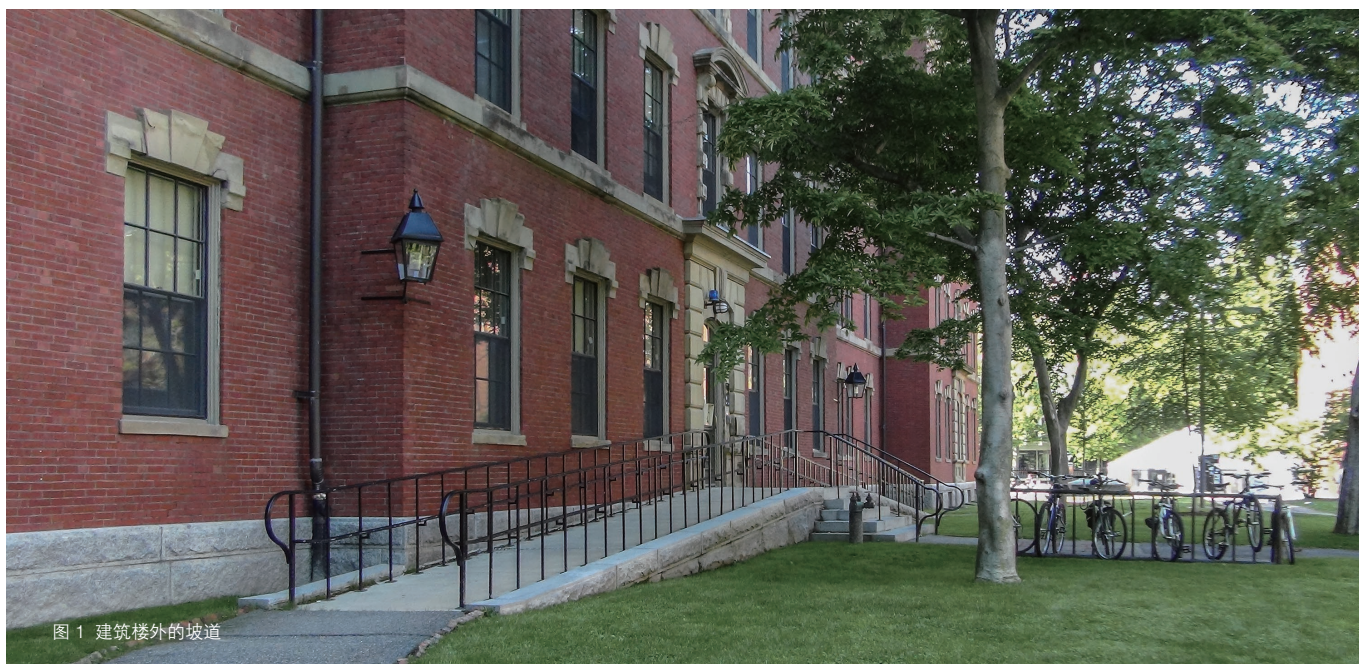
图1 建筑楼外的坡道

英国现代杰出的现实主义戏剧作家，曾因作品具有理想主义和人道主义而获得诺贝尔文学奖的萧伯纳(George Bernard Shaw)说过：正常人努力让自己适应社会，而特殊人群必须需要社会适应他们，所以所有过程是否可行取决于特殊人群。 [1] 20世纪50年代，两次世界大战和自然灾害导致很多伤残者的出现，帮助这些人群解决日常生活中各种困难促进了美国、日本和欧洲无障碍设计的发展。通用设计(Universal