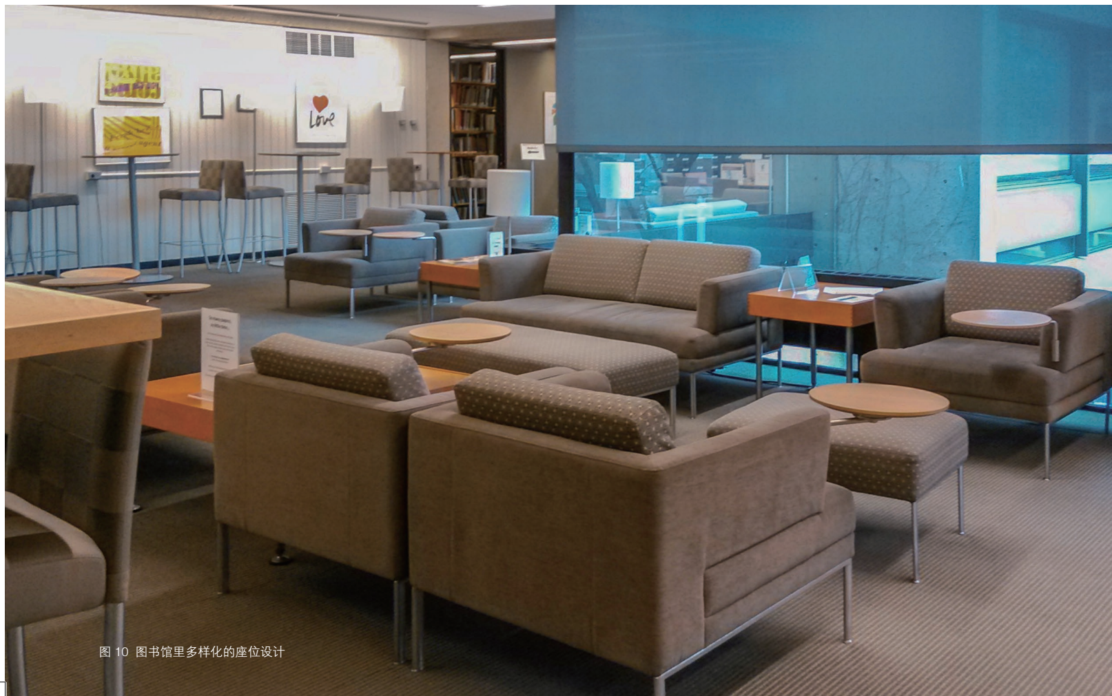
图 10 图书馆里多样化的座位设计