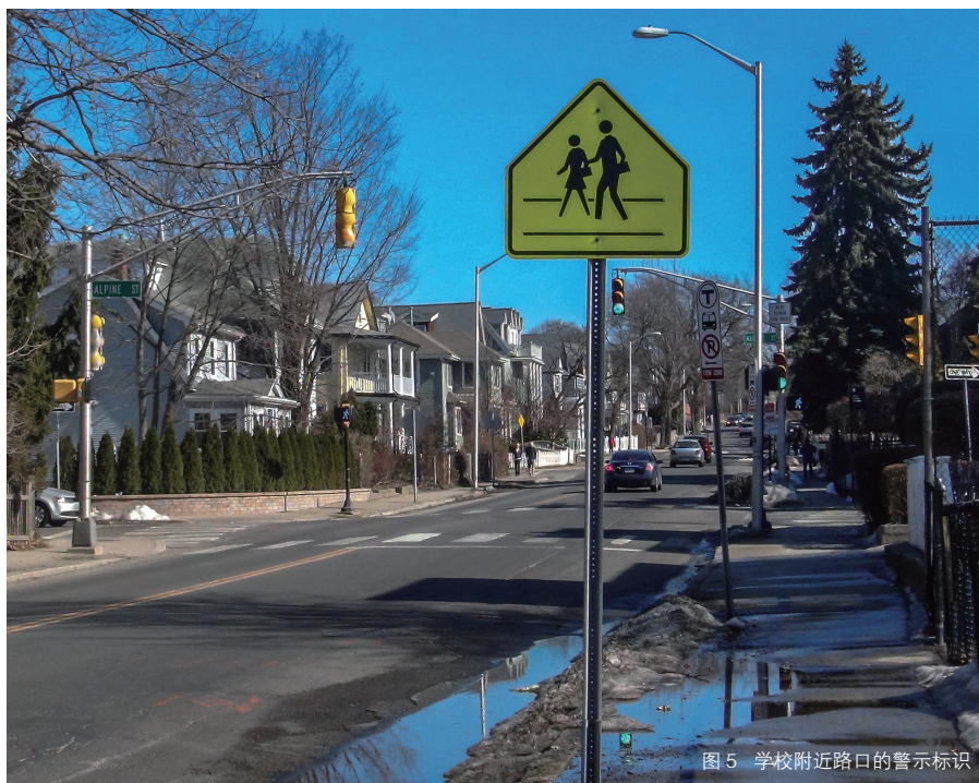
图5 学校附近路口的警示标识