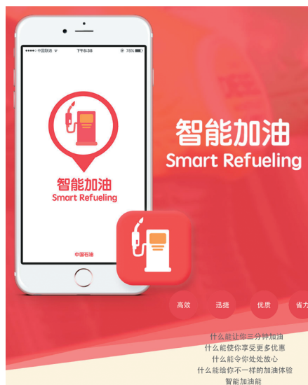
图 1 智能加油站 APP 王国俊团队“中石油+互联网”产品设计图

我国加油站由国有加油站、外资品牌和民营加油站组成，“中石油中石化在一二线城市占比 60%，而其他社会加油站在一二线城市的占比 35% 左右。” [2] 目前加油站的经营发展方面主要突出问题是如何提升油站“坪效”。现有业务、服务扩展模式如洗车服务，加油站+超市等方法并不成功，销售额差异巨大，产值