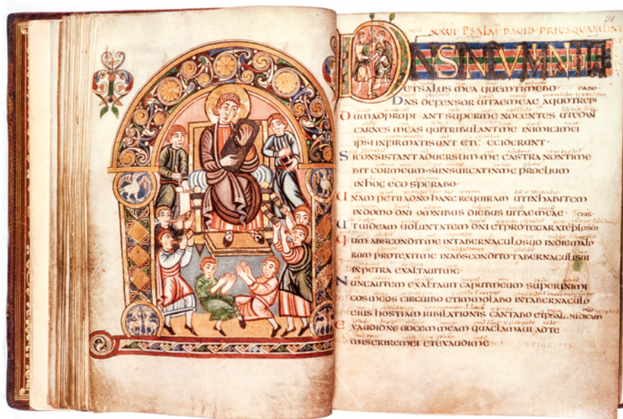
图 1 早期中世纪手抄艺术——维斯帕先圣诗集

较接近于近代书的装帧形式，可视为西方最早的书。西方书籍文明发展到中世纪（约公元 476 年 ~ 公元 1453 年）初期开始逐步形成统一形制，采用羊皮纸 1 手工抄写书籍，这成为印刷术发明以前西方国家文化传承的基本方式。中世纪的手抄本因其独特的艺术魅力、美轮美奂的工艺技巧、虔诚的宗教信仰，形成了西方书史上最具特色的传统。至文艺复兴时期，印刷术出现，促使手工书向