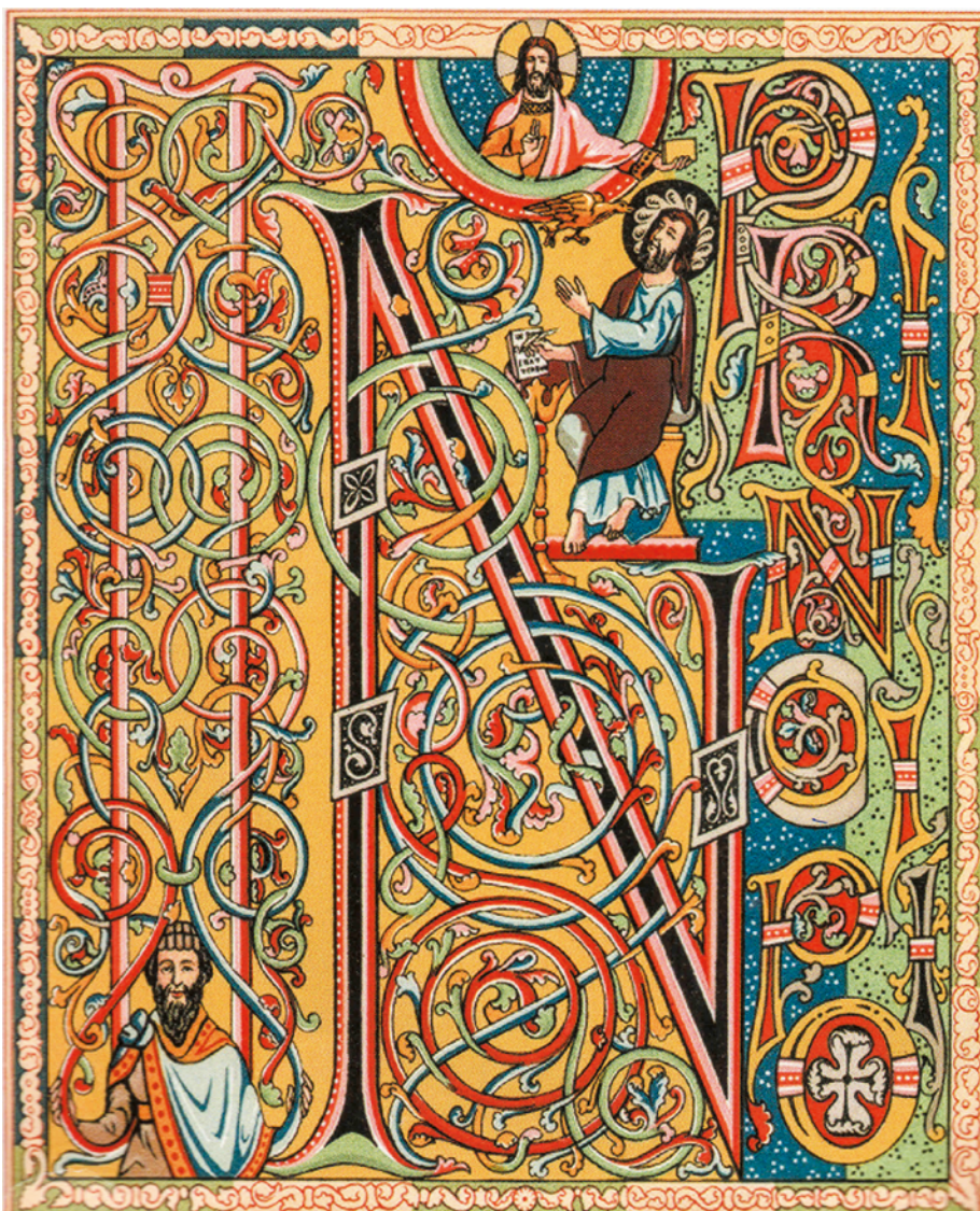
图3 12或13世纪手抄本大写字母

一个农场或一个葡萄园的价值，需求的稳定增长导致商人开始进行流水线分工劳动，撰写文字、装饰花边、镶金、校对、捆绑，但即使是这样，手抄书仍然无法满足需求；中国的造纸术在12世纪中期起便陆续传入欧洲各地，廉价优良纸张的应用和普及，为欧洲印刷术的出现奠定了基础；中国的雕版印刷13世纪起沿着丝绸之路陆续传入欧洲各国，欧洲之前已经流行摹刻印章和织物印花