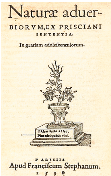
图7 夏尔·艾蒂尔(Charles Estienne)的书籍《naturæ na nomenclaturæ》的封面设计,1538年。

书籍的框饰在意大利文艺复兴时期兴盛了一段时间之后,逐渐地没落,如一些插图的框式逐渐地变细、变小,甚至于完全消失。到中后期书籍的重点在于文字内容的叙述,而逐渐地淡化装饰,这也是书籍设计的观念从神性向人性转变的体现。