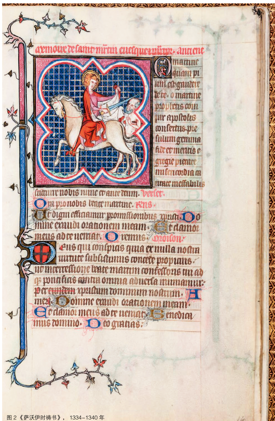
图2 《萨沃伊时祷书》, 1334-1340年

14、15世纪印刷术在欧洲的产生和普及的主要原因是:大学和资产阶级的兴起,社会对典籍的需求十分巨大;中世纪的手抄书制作过程十分缓慢,简单的200页的书需要四五个月的劳动才能完成,且羊皮纸的价格很昂贵,在当时,一本书的价值相当于