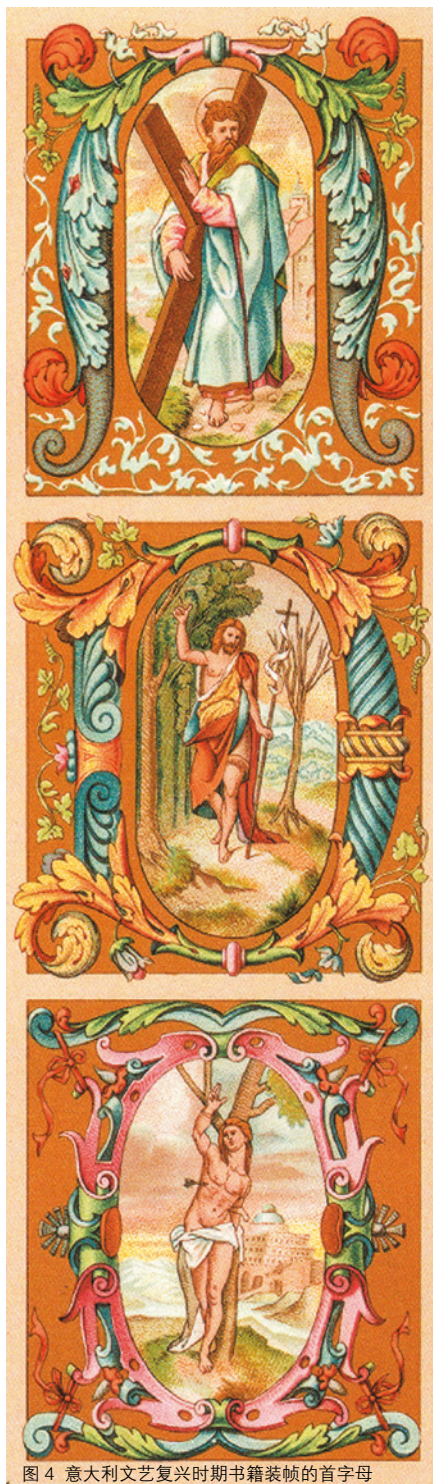
图4 意大利文艺复兴时期书籍装帧的首字母