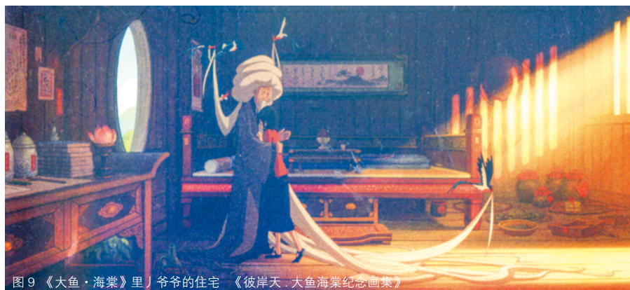
图9 《大鱼·海棠》里爷爷的住宅 《彼岸天·大鱼海棠纪念画集》