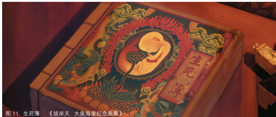
图11 生死簿 《彼岸天·大鱼海棠纪念画集》