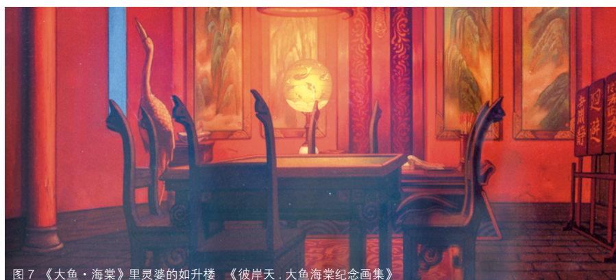
图7 《大鱼·海棠》里灵婆的如升楼 《彼岸天·大鱼海棠纪念画集》