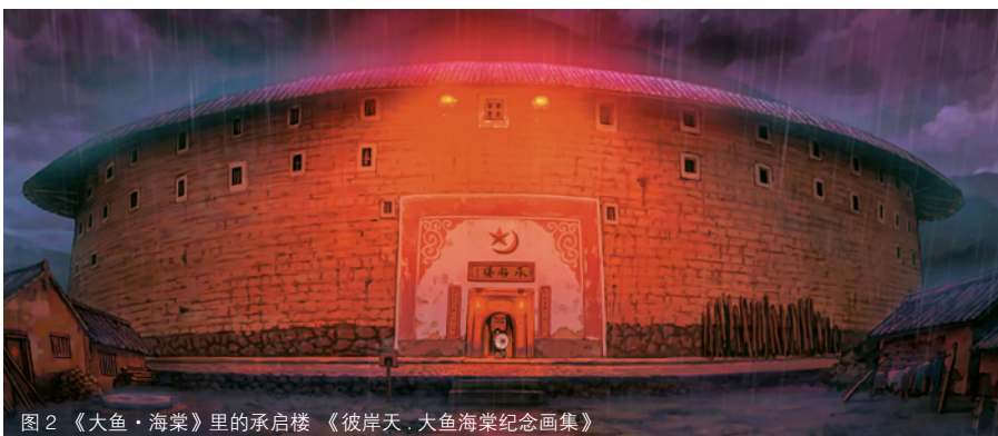
图2 《大鱼·海棠》里的承启楼 《彼岸天·大鱼海棠纪念画集》

是中国文化中的基本崇尚色，符合整部剧的视觉风格。同时，屋内红色昏暗又营造出诡谲的气氛，与灵婆掌管人类生死的职业相符。而水波纹兽面案台，“回避”、“肃静”、“奉政大夫”的牌子，红头签牌和签筒等等，又似古代衙门正堂，严肃凝重、阴郁沉闷。此外，屋内还有非寓意式的元素拼接，如墙上还挂有四幅青绿山水画 2 ，这是传统古代文人雅士布置房屋的首选；墙脚放有立式铜鹤，这与故宫里的铜鹤（图8）相似度近百分之百；屋内摆放的桌椅，则是传统家具文化的代表——明式家具 3 。跟随灵婆的脚步，镜头转向通天阁，又是另外一番景象。层层向上的灵魂存架充满整个屋子，跟古代藏经阁类似。“是色是空莲海慈航游六度，不生不灭香台慧镜启三明。” [3] 灵魂存架，有莲花外框、底座，莲花是佛教象征符号。传说众生若得善报，不再堕入胎生、卵生、湿生