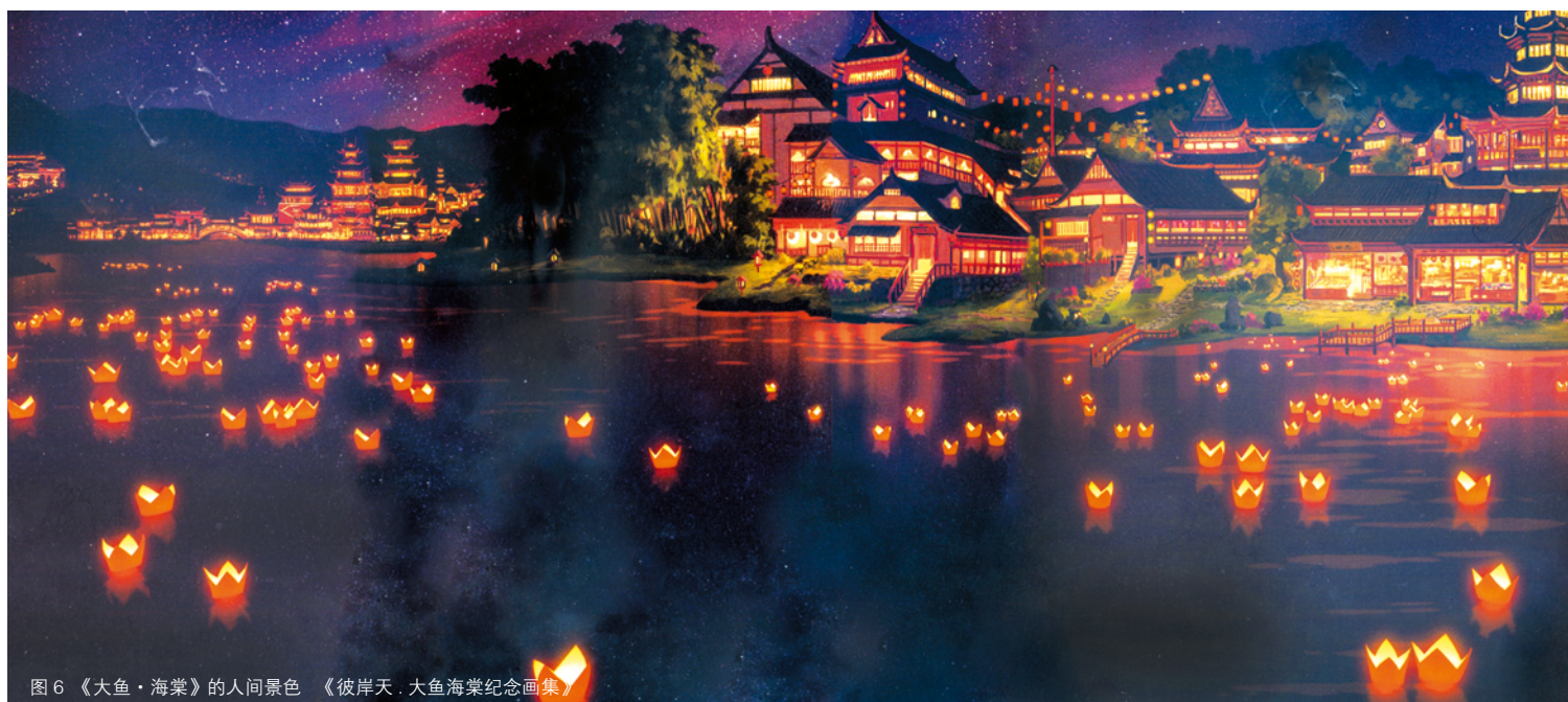
图6 《大鱼·海棠》的人间景色 《彼岸天·大鱼海棠纪念画集》

《大鱼·海棠》在内景设计方面也特别注重中国民族元素的运用，它对传统民族民俗文化进行了重新描绘，动画全剧彰显着鲜明浓厚的本土特色。“生命之至，彼岸而止；灵化小鱼，沉睡如升。” [2] 内景的民族元素运用以灵婆居住的如升楼（图7）为代表，进入屋内首先映入眼帘的是红墙褐砖，红色