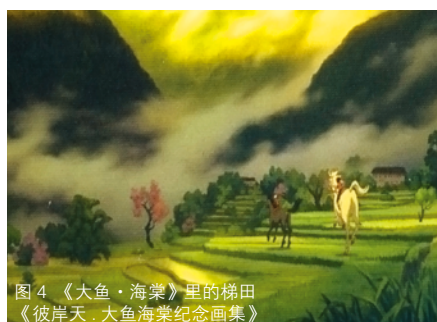
图4 《大鱼·海棠》里的梯田 《彼岸天·大鱼海棠纪念画集》