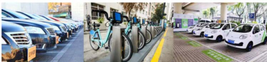
图6 城市共享服务系统

在其理论研究中，本雅明强调了群众的主观能动性，受众不仅局限于被动地接收信息，反而拥有独立的设计思维以及主观创造性。“大众是促使所有现今面对艺术作品的贯常态度获得新生的母体。” [5]62 。本雅明区别于其他具有精英意识的研究观点，强调群众在信