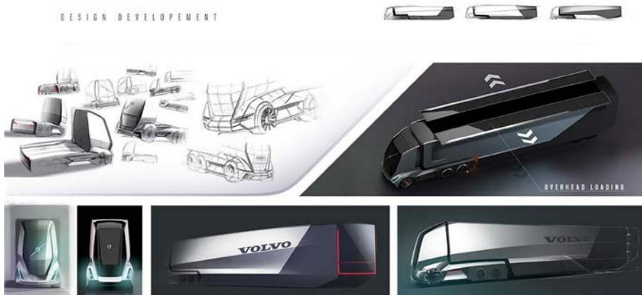
图7 沃尔沃卡车迭代的历程