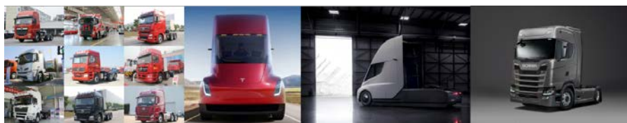
图4 传统功能性产品向服务性产品的转化

本雅明着重强调艺术作品在时空双重层面上的原真性这一特质，提出机械复制时代技术也为产品营造了新的时