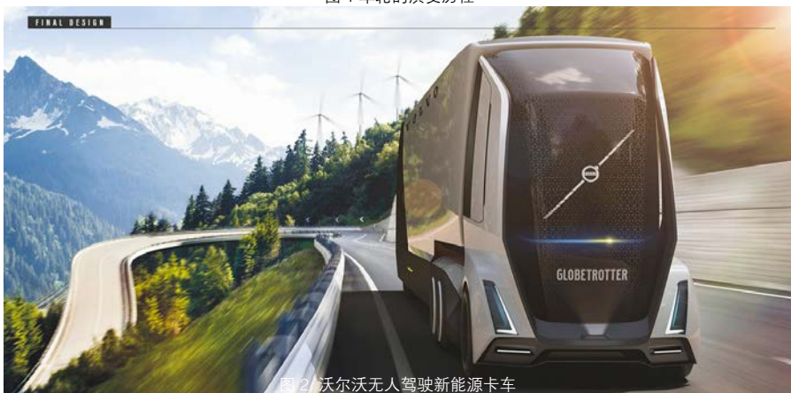
图2 沃尔沃无人驾驶新能源卡车