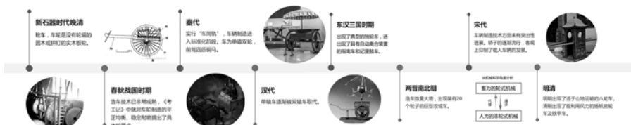
图1 车轮的演变历程

本雅明在这个论点中认为技术复制比手工复制更独立。他举例说受客观原因的限制，原作中极大程度上存在着受众难以辨别的部分，只有通过摄影技术才能使这些部分得以区分。不同镜头的转换影响了拍摄角度的转化，从而体现了崭新的艺术内涵。而从产品设计的角度来讲，基于自动驾驶技术的新能源卡车的出现正是得益于技术的发展，通过探寻艺术品的时间属性——车轮的演变