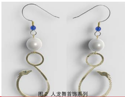
图2 人龙舞首饰系列

随着游客的文化水平不断提高、旅游经验更加丰富，他们的品位也在不断提升，游客们的消费也将逐渐理性化，会更加注重体验旅游目的地的特色文化、风土人情，使得旅游向着多元化、文化性、新奇性等方向转变。开发民俗艺术主题文化游，打造湛江的“文化游”品牌，让游客享受湛江美景美食的同时，感受湛江的红土文化，让民俗文化通过游客的美好回忆“走出去”，既能使民俗艺术在传承和保护之中有创新的融入经济生活，又能促进湛江旅游产品的综合竞争力。