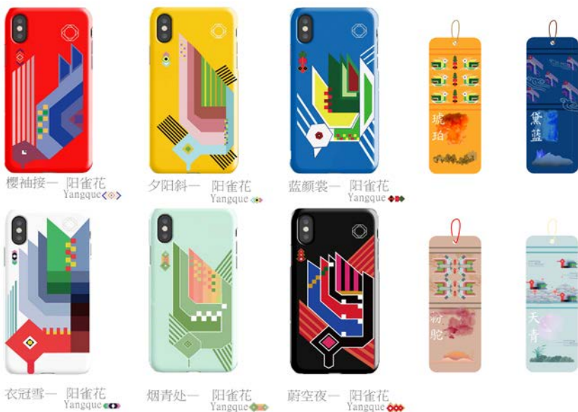
图 11 阳雀花系列手机壳、书签