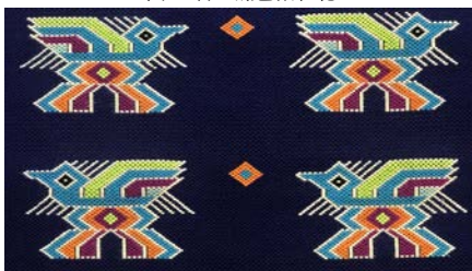
图5 湛蓝底色阳雀花