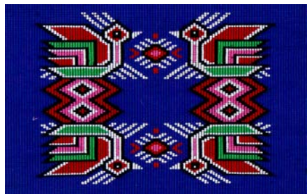
图4 普兰底色阳雀花