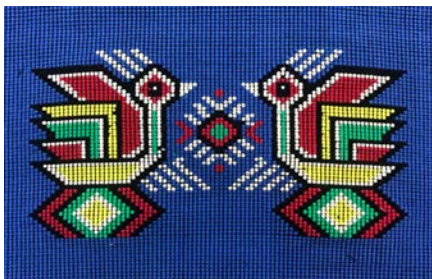
图3 普兰底色阳雀花

蓝色底的阳雀花西兰卡普在 6 个色系中所占数量最多，共有 26 幅。根据色相的划分，蓝色又分为普兰、深蓝、天蓝三种，其中，普兰底色有 14 幅，深蓝底色有 7 幅，天蓝底色有 5 幅。在配色方面，多以大红色、橘红色、金黄色为主，零星赭石、紫色为点缀，阳雀花轮廓多用黑白两色进行勾边，少许