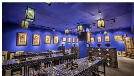
图2 湖南雨花非遗馆滩头年画传习所