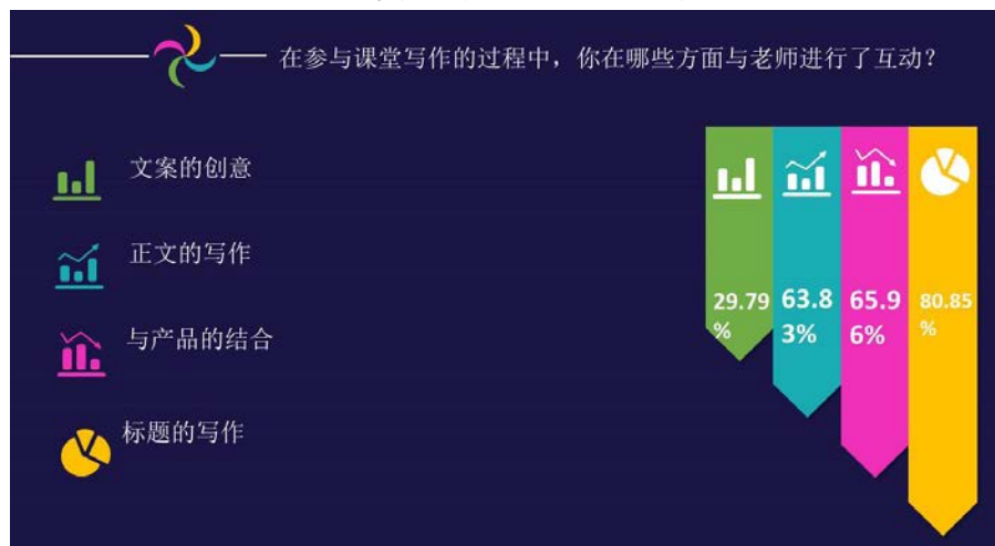
图 2 调研问卷：结合 BOPPPS 学生与老师进行的互动（多选题）