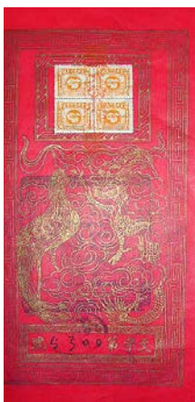
图4 民国结婚证书中的“龙凤”图案