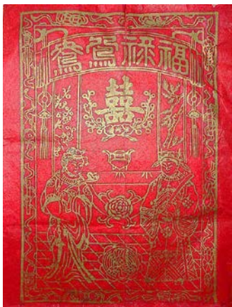
图3 民国结婚证书中的“结婚新人”图案