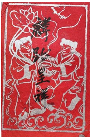
图1 民国结婚证书中的“和合二仙”图案

祥瑞神兽类以龙凤(见图4)、麒麟、仙鹤、神鹿等传统神话中的神兽为主,其中龙和凤可作为主题图案单独出现,