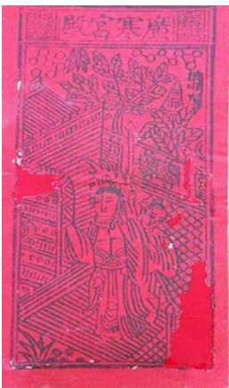
图2 民国结婚证书中的“广寒宫殿”图案