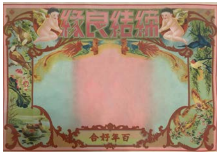
图 11 交会期的民国结婚证书

从国风主流审美的再次复兴可以看出,民国晚期的视觉设计又回归到了传统的借物抒情。基于中华民族深厚的文化底蕴,借用国画中的花鸟鱼虫等写实题材,民国结婚证书上的图案在传统水墨画技法的基础上,又吸收了西方写实油画的艺术特点,设计出符合战后审美趣味图案的同时,也反映了当时的人们