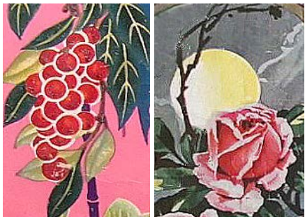
图8 民国结婚证书中的“葡萄”图案

20世纪30年代至40年代中期是民国结婚证书发展的鼎盛期，此时的图案设计更倾向于以一种猎奇或理想化