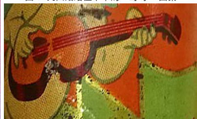
图7 民国结婚证书中的“小提琴”图案

词语中的典故，将日常所见的花瓶、如意、灯笼、屏风、梳妆镜等博古物，组合成托物喻理的“连生贵子”（见图6）“平升三级”“吉庆有余”等吉祥词语。《辞海》中对“博古”一词的解释为：“图绘古器物形状的中国画，或以古器物作为图形装饰的工艺品，如博古画、博古屏等。” [31]187 一般而言，博古图案的概念是随着社会文化的演进而不断更新其形式与内容的，凡装饰图案中出现的各类古玩器物均可统称为“博古”。博古图案的使用，既可以体现出中华文明的连贯性和独特性，同时也具有极强的装饰功能，象征着历代人们所追求的高节清风品格。