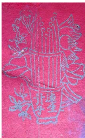
图6 民国结婚证书中的“连生贵子”图案