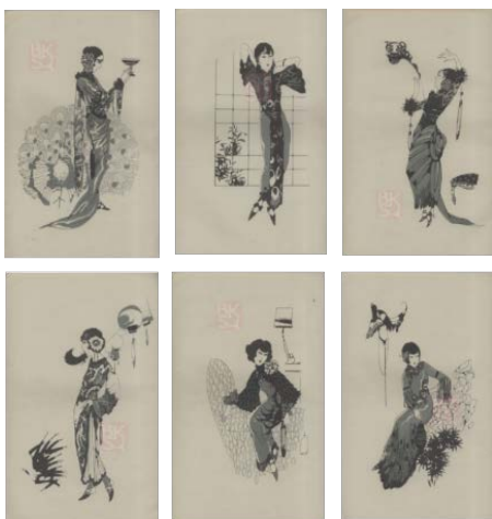
图4 《装束美》中的部分仕女画

的文化，简明地说一句，就是人生的艺术化……西洋人不把我们当作是一个优秀民族，就是因为我们的生活，太没有艺术化的缘故。” [11]