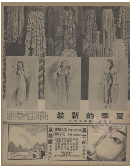
图2 1939年刊登于《新新画报》的《夏季的新装》