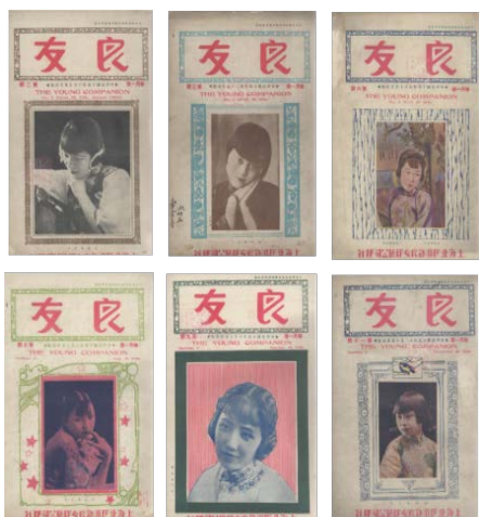
图3 《友良》画报 1926年出版的杂志封面