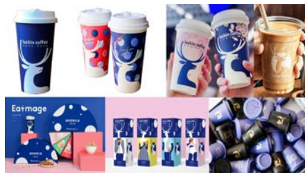
图4 瑞幸咖啡的包装设计

一是文化创意设计要采用多种载体相结合的方式。文化创意设计包含创意故事、创意产品、创意视觉设计等多个不同层面,不同层面有着不同的侧重点。比如创意故事通过对普通广告进行重新编写,将广告变成了电影,将产品变成了情感,侧重于提升用户的心理感受;创意产品侧重将文化融入产品设计中,满足用户在艺术、娱乐等多方面的需求;创意视觉设计侧重使用视觉元