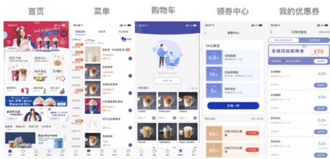
图11 瑞幸咖啡App用户下单操作路径图