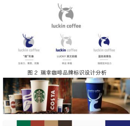
图3 瑞幸咖啡品牌与其他咖啡品牌的主体色对比图

载体，也是品牌内在价值的传播媒介 [5] 。品牌的视觉形象与品牌密不可分，品牌的视觉形象设计能够有效体现品牌的特性，良好地反映品牌的实力与特点，从而增强消费者对品牌的记忆，提升其知名度。通常，品牌的视觉形象主要通过视觉形象系统来传播品牌理念和品牌文化，其内容包括品牌的标识设计、色彩设计和包装设计等，不同的设计内容有着不同的评判标准。