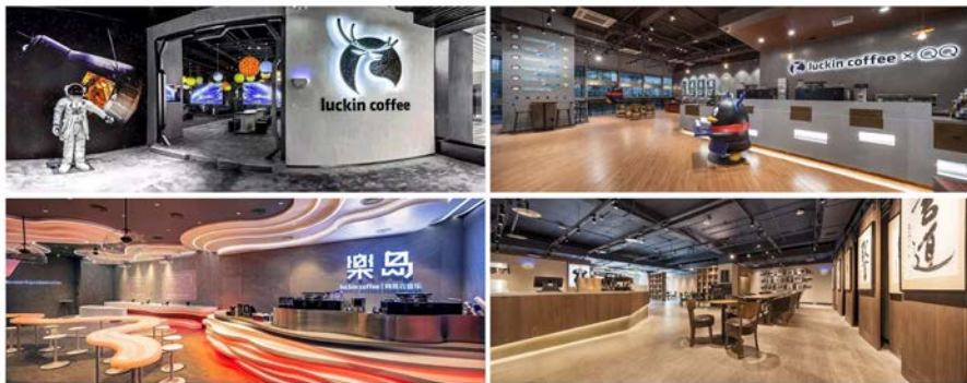
图 13 瑞幸咖啡体验店设计