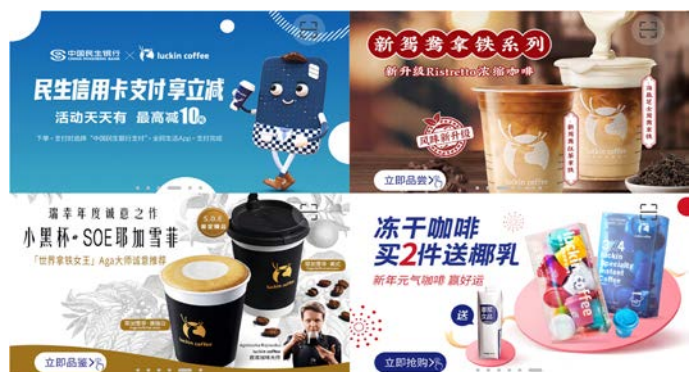
图9 瑞幸咖啡App中的营销活动

由于使用瑞幸咖啡App的用户最终目的是要下单完成商品的购买，因此，该产品交互体验的重点应该集中在引导用户进行购买的操作上。通过瑞幸咖啡App用户下单操作路径及交互流程图可以看出（见图11、图12），瑞幸咖啡App的下单引导体现在多个业务场景中，如把优惠券、购物车等场景与下单紧密联系在一起，结合明显的按钮标识引导用户快速完成下单操作。每个业务场景的交互体验都对用户操作习惯进行了拆解与分析，使整个交互流程达到简单直达的目的。瑞幸咖啡App作为一款快速消费软件，用户停留在App上的时间其实并不多，在下单操作的流程中，用户只需选择好消费的饮品，直接完成购买即可，并不需要跳转至购物车界面。因此，笔者认为，将购物车功能设计为主页面的第一层级