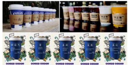
图7 瑞幸咖啡的杯套文案