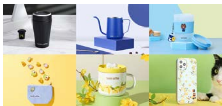
图6 瑞幸咖啡的文化创意设计

随着互联网产业的发展,越来越多的企业会选择使用微信小程序来替代App作为推广平台,原因在于用户下载