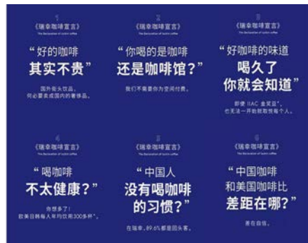
图5 瑞幸咖啡的六条咖啡宣言