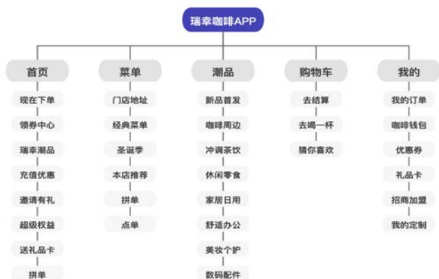
图10 瑞幸咖啡App功能构架图