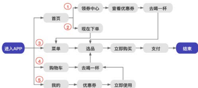
图12 瑞幸咖啡App用户下单交互流程图