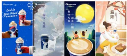
图8 瑞幸咖啡宣传海报设计