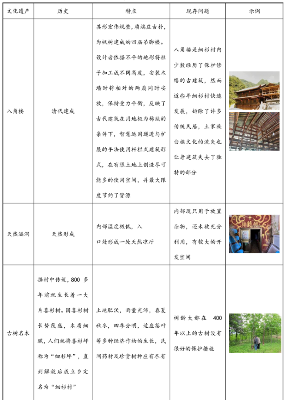
表2 存在相关问题的文化遗产

细杉村是土家族苗族文化生态保护试验区的一部分,充分彰显了长江流域的民族文化和多姿多彩的人文和生态资源。然而,受限于地理环境与人口低