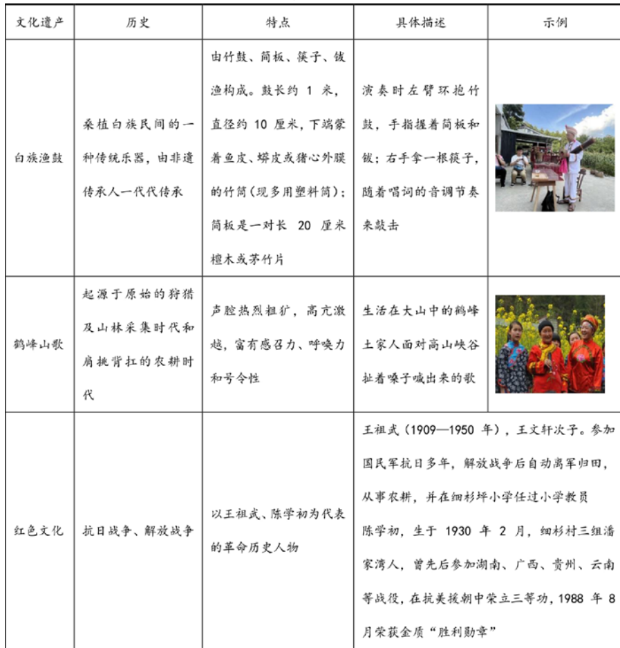
表1 细杉村非物质文化遗产

第一,以种植业为主导的第一产业构成脆弱,发展受约束。虽然目前茶产业在建立了科学的合作机制、先进的管理机制,以及特色的营销策略情况下经