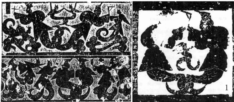
图1 武梁祠画像石中的三个伏羲女娲像

通过上述文本的分析，笔者深入探寻了伏羲女娲主题的文化内涵，从视觉形象到语言表述，从历史资料到学术解