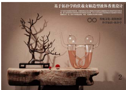
图2 伏羲女娲香薰瓶设计效果图

综上所述,守正创新不仅是对传统文化的尊重,更是对当下社会需求的回应。通过将传统与现代相结合,我们可以创造出新颖、有趣且有价值的产品,同时保持文化的延续性和活力。这种新体新用的设计理念不仅能够满足市场需求,还能够为文化输出提供有力支持,