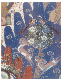
图2 第171窟主室券顶左侧动物