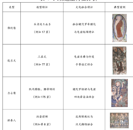
表4 人物造型特征分析