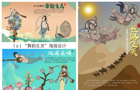
(a) “舞韵生灵”海报设计 (b) “阮咸乐鸣”海报设计 (c) “丝路飞天”海报设计 图6 海报设计