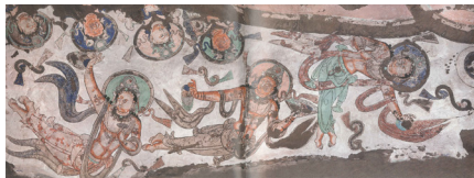
图5 新1窟后室券顶飞天