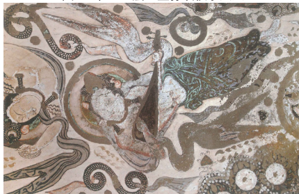
图4 第69窟后室券顶飞天