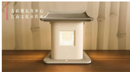
图2 “青砖黛瓦寄乡心”小夜灯效果图